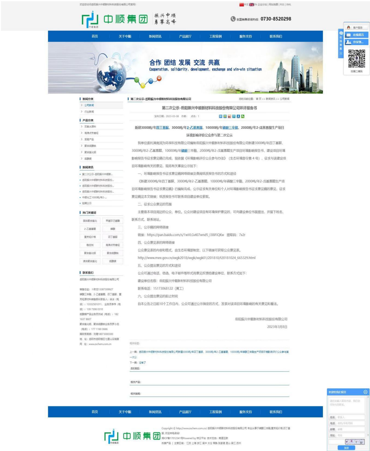
图2 第二次网络公示