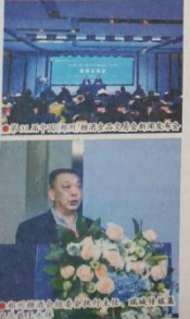
河南省餐协加盟两大重磅会议加持第31届中国(郑州)糖酒食品交易会下月举办

今日 第 069 期 总第 10703 期 企业家日报社出版 编辑:郑梅 版式:黄健 全年定价:450元 零售价:2.00元 2023年3月21日 星期二 第9年 二月三十